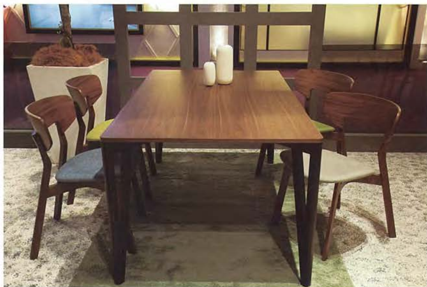
■民用家具组银奖 (461 + 21311-2)