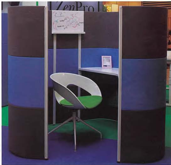
■ 办公室家具组银奖 Z3 WORKPODS