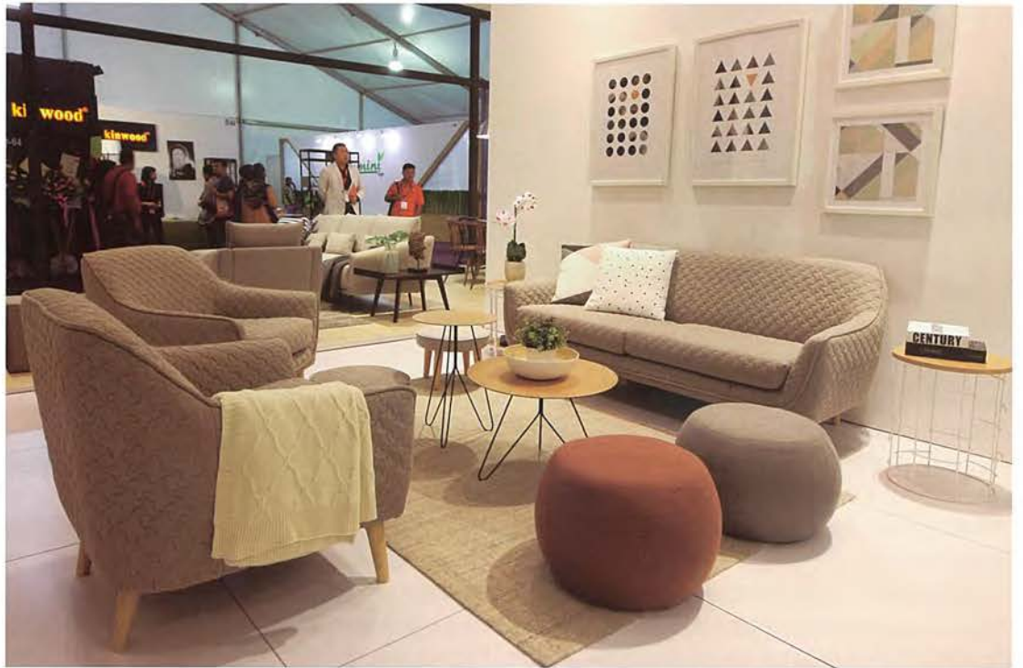
■ 评审表扬奖白金奖 (ELLY)