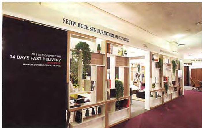
■标准展位第一名(SEOW BUCK SEN FURNITURE (M) SDN BHD)

PRODUCTS(M) SDN BHD》，展位编号：4B10，卓越家具大奖同样分为三组，获得白金奖的作品分别是民用家具组MCKENZO DESIGN SDN BHD的《VENICE》、办公室家具组OASIS FURNITURE INDUSTRIES SDN BHD的《LOLLA》、评审表扬奖DEESSE FURNITURE SDN BHD的《KELLY》。