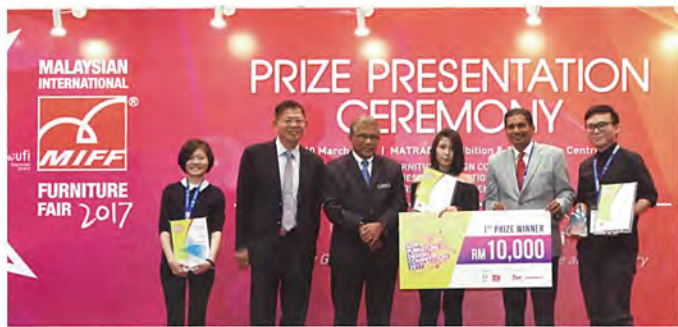
■ MIFF FDC 2017 —— 获奖者合影