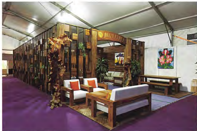
■光地展位第一名(ALUNAJATI SDN BHD)