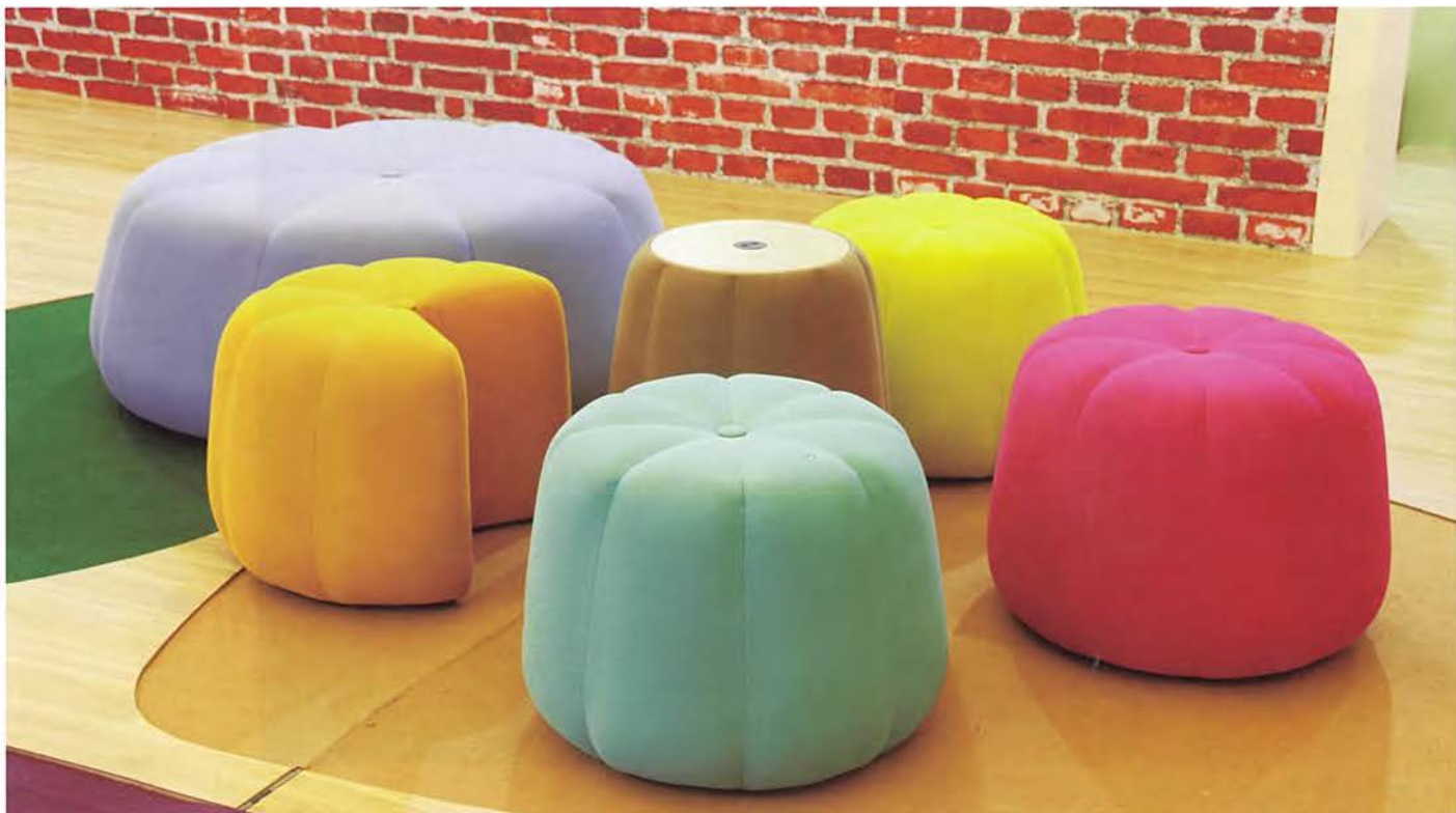
■ 办公室家具组白金奖(LOLLA)