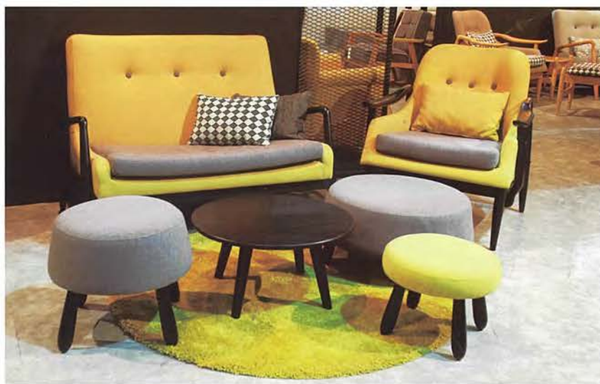
■民用家具组金奖 (K1283 LOUNGE CHAIR + K1282 LOVESEAT + OTTOMANS)