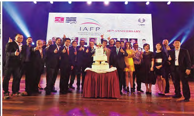
■大赛现场嘉宾合影