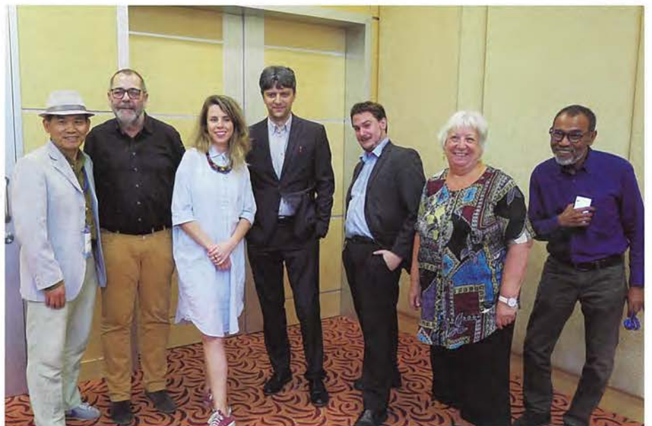
■2017MIFF卓越家具设计大奖评审现场

虽然当今世界正吹着复古风,但一些新近推出的,颇具北欧和日式设计元素的家具仍然在MIFF展出,这并非是件坏事。