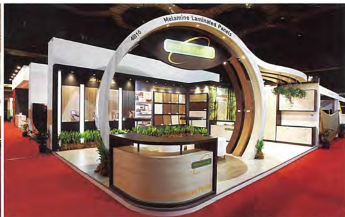
■非家具展位第一名(GREEN PANEL PRODUCTS (M) SDN BHD)