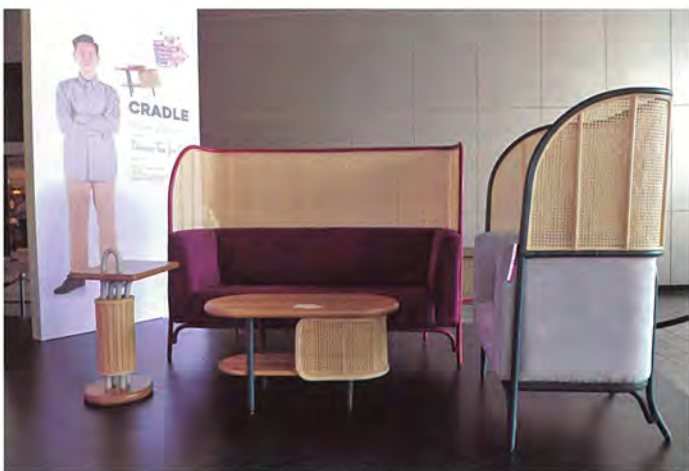
■ 决赛入围者 Daecan Tee (Cradle)