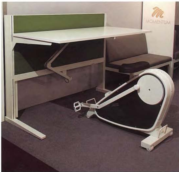
■ 办公室家具组金奖 (XT DESKING/SEATING)

的获奖作品中，还有一款金奖作品，就将“自行车”的“登踏”动作有机地嫁接在办公椅上，算不上“开天辟地”头一回，但在“节能”、“低碳”、“环保”的基调上，却实现了“工作”与“健身”的统筹与互动！这样的家具设计思路不仅是一种偶然为之，更是一种“设计思维”；一种“生活方式”的设计趋势。