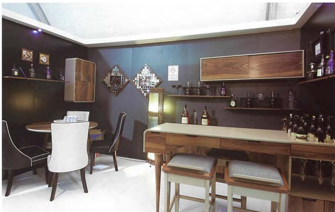
■民用家具组白金奖 (VENICE)